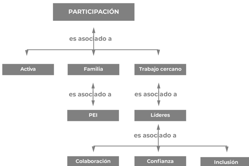
Fig. 2: elaboración propia

En esta categoría se describe la aproximación conceptual que la política educativa en