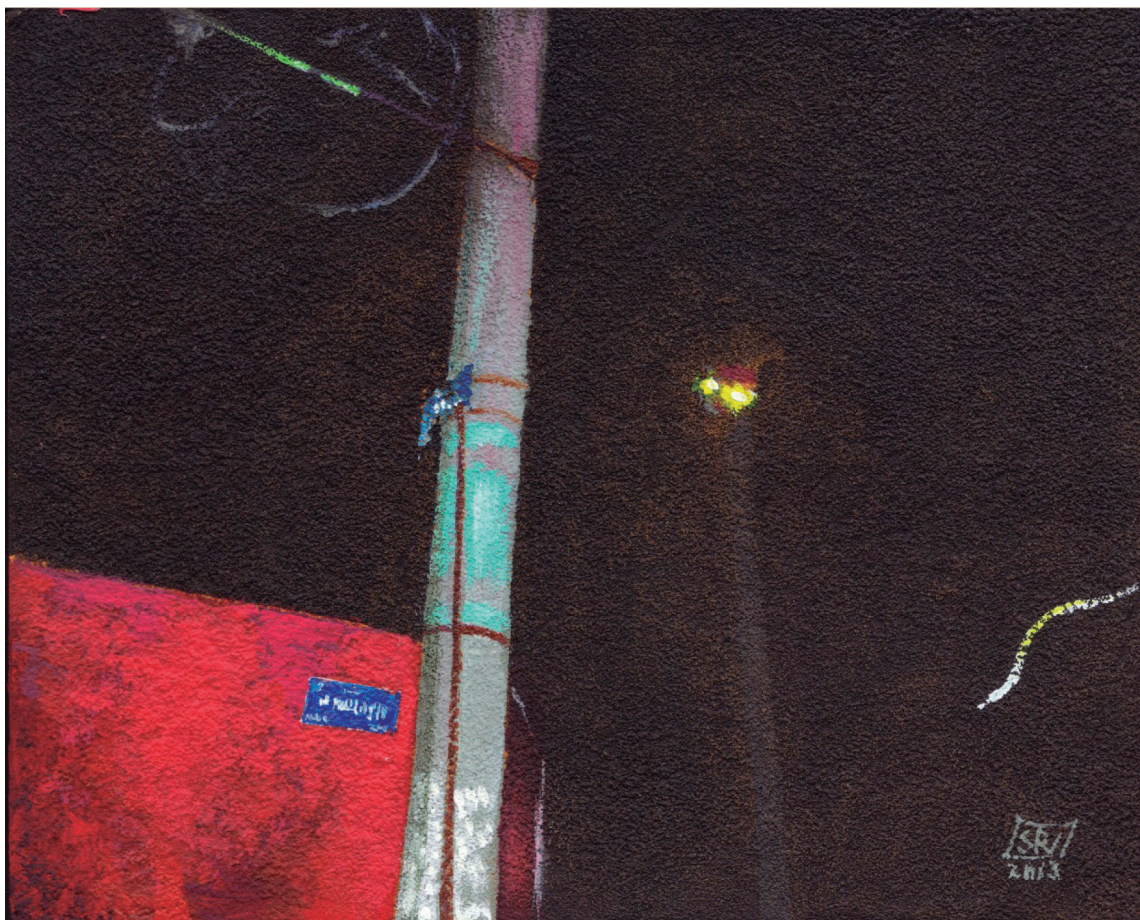
Título: " Noche con rojo "