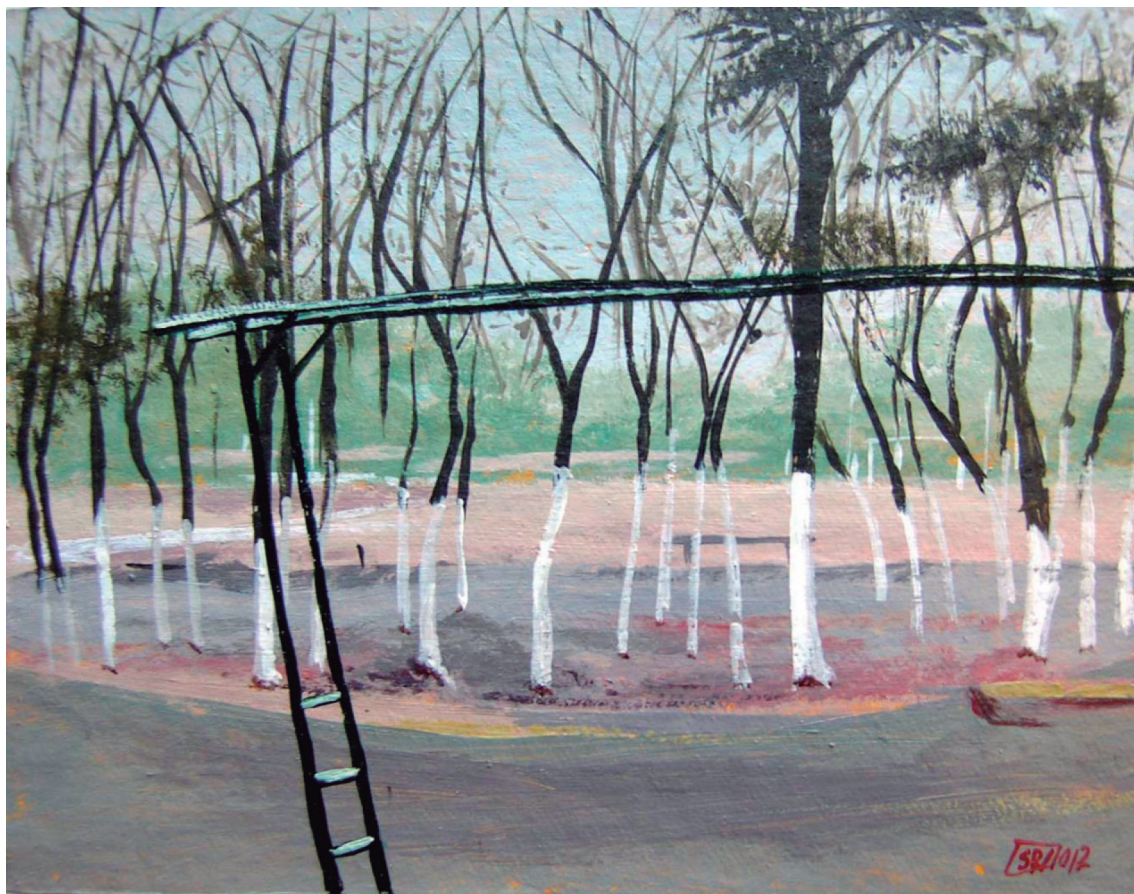
Título: " Parque II"