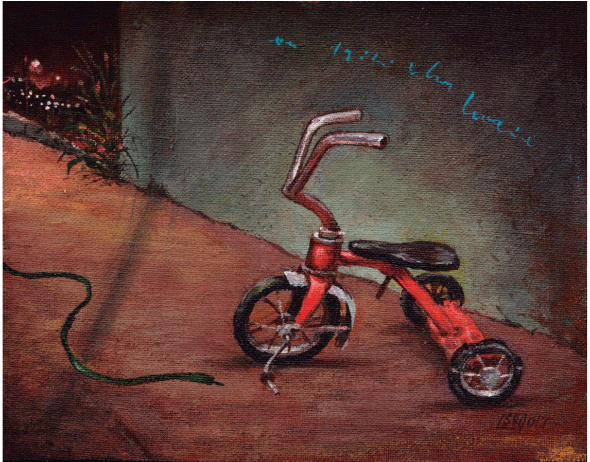
Título: "Triciclo vacío"