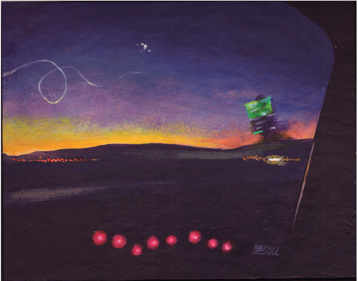
Título: "Paisaje con luces IV"