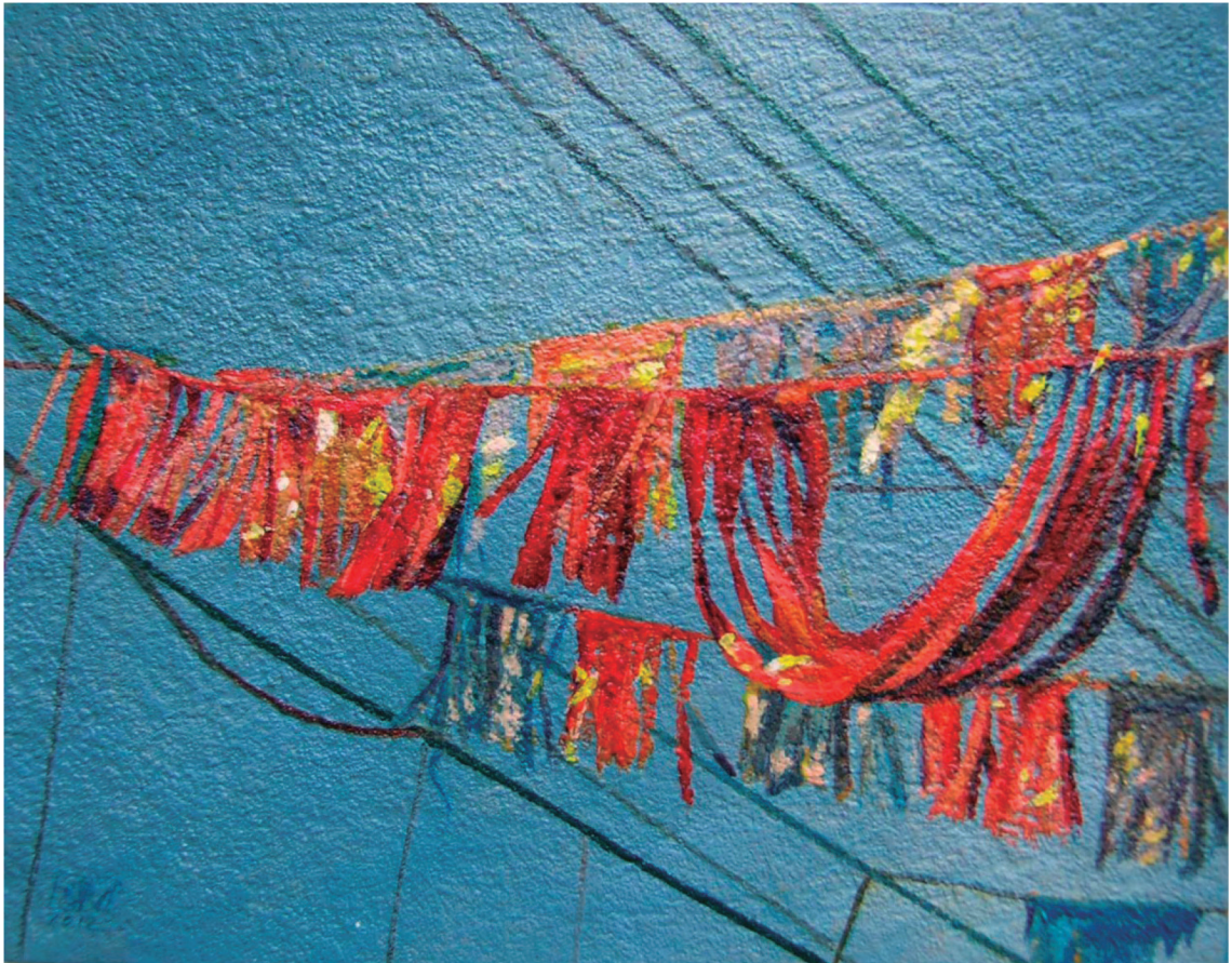
Título: "Colgijes II"