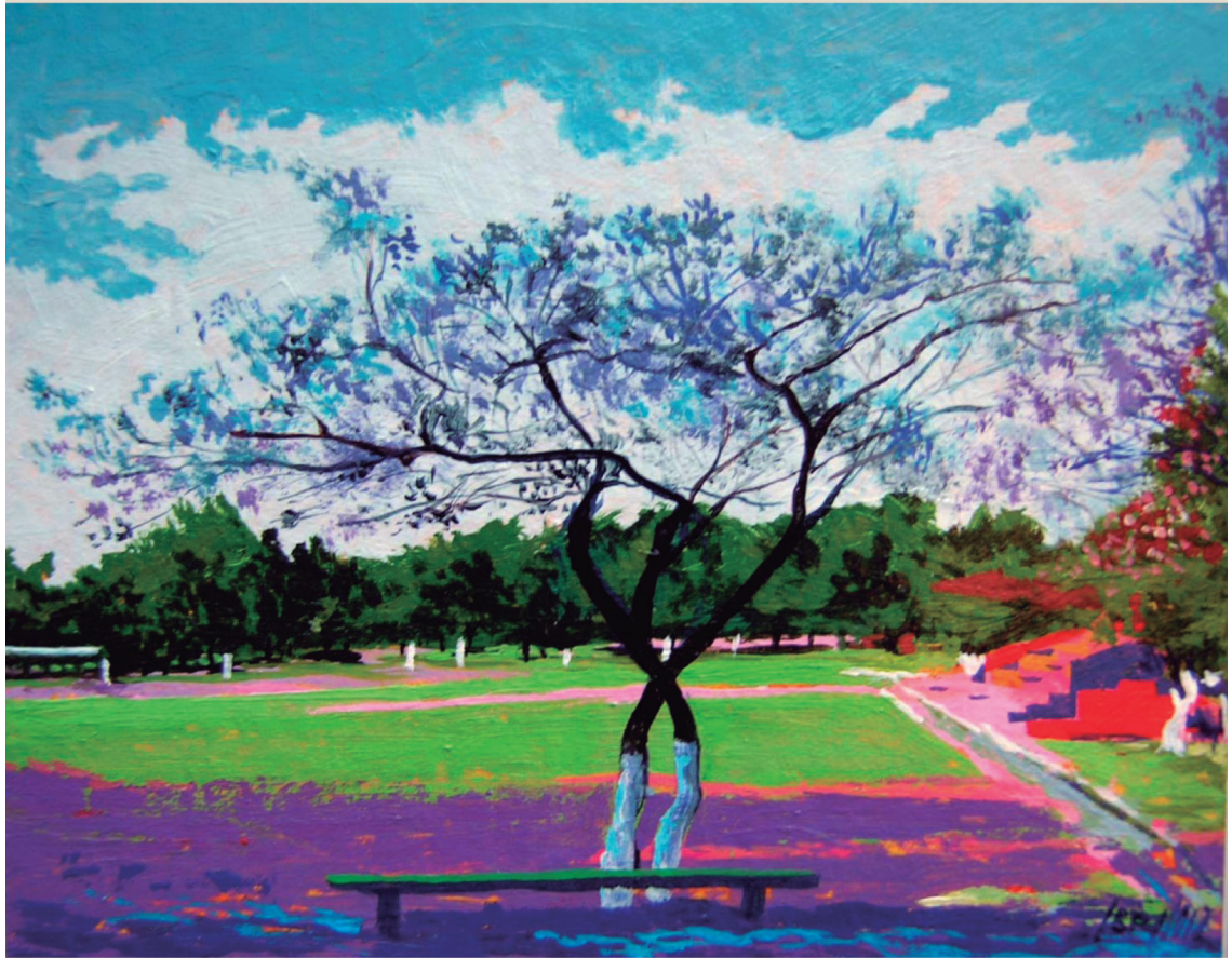
Título: "Parque I"